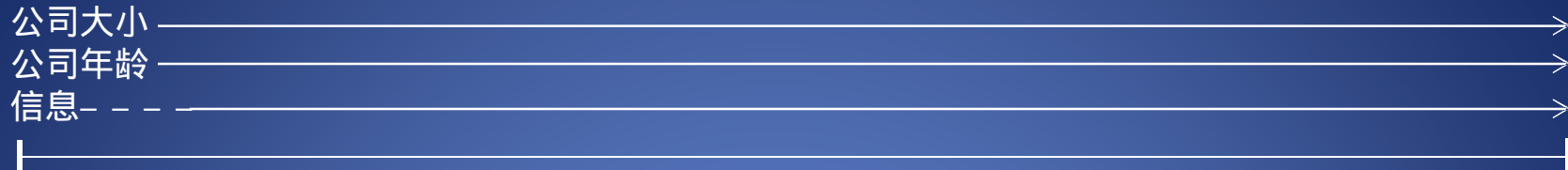
图表1 公司成长与资金来源