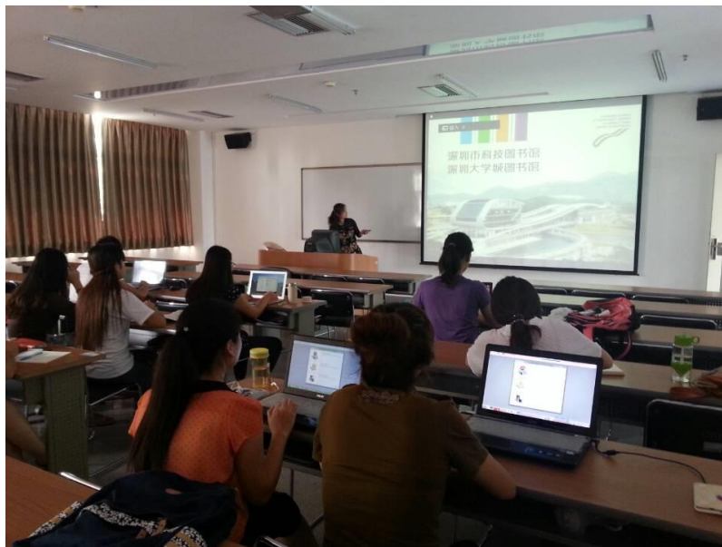
该课程的第一次嵌入式教学课（在老师的课堂上）