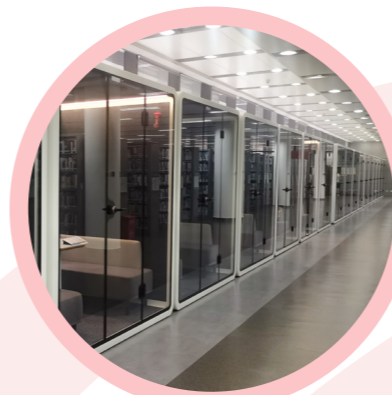
▲ 二楼、三楼多人静音仓