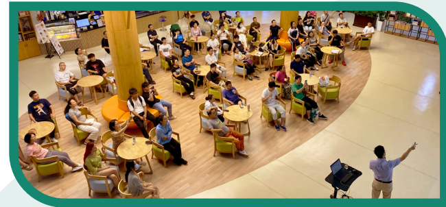
● 2023年“听·说”文化讲座活动现场

“听·说”文化讲座选取读者所喜闻乐见的文化主题，寻找读者中的乐活份子，让读者们一起分享知识、经验和见解。让你听我说，成为自然、轻松、有趣的交流。