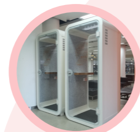
▲ 二楼、三楼单人静音仓